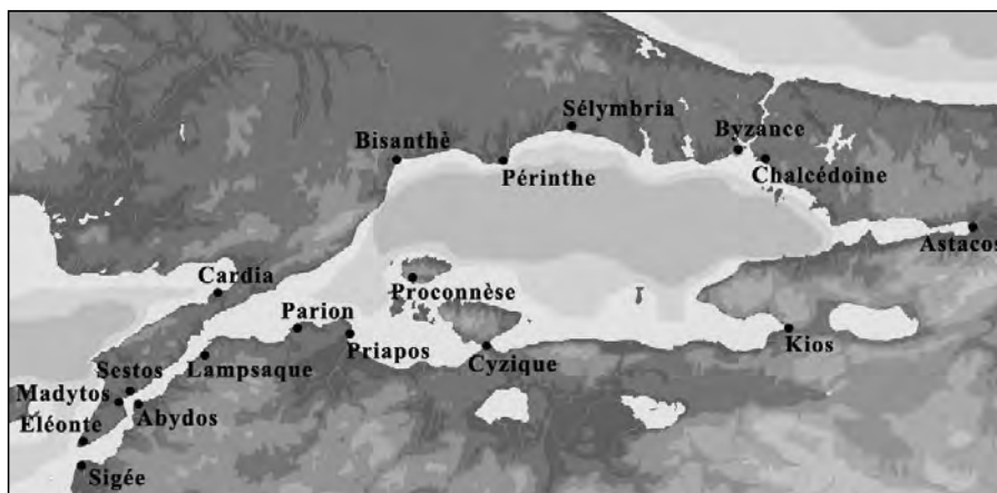
Fig. 2. Carte generală des cités grecques sur les côtes de la Propontide (apud Robu 2012, 195)