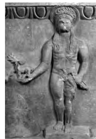
Fig. 3. L'image d'Apollon Didymeus (relief découvert dans le théâtre milésien, III e siècle apr. J.-C. apud Dirschedl 2019, 242, fig. 6 b)