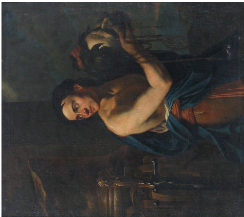
Pl. II. 1. Palatul muzeal în care au fost mutate colecțiile în anul 1891 (dreapta, prim-plan). 2. Jan Kupecký, David cu capul lui Goliath , ulei pe pânză, 106 × 93 cm. / 1. The Museum Palace where the collections were moved to in 1891 (on the right foreground). 2. Jan Kupecký, David with the Head of Goliath, oil on canvas, 106 × 93 cm.