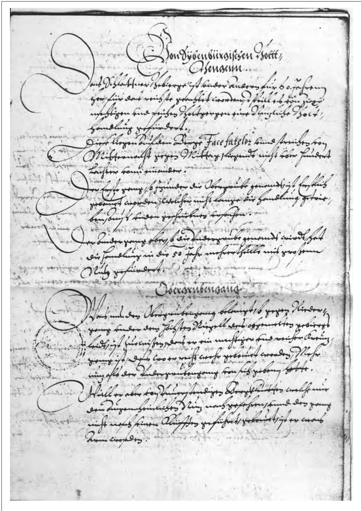
Pl. II. Prima pagina a conținutului doc. nr. 1 / First page of the content of doc. no. 1