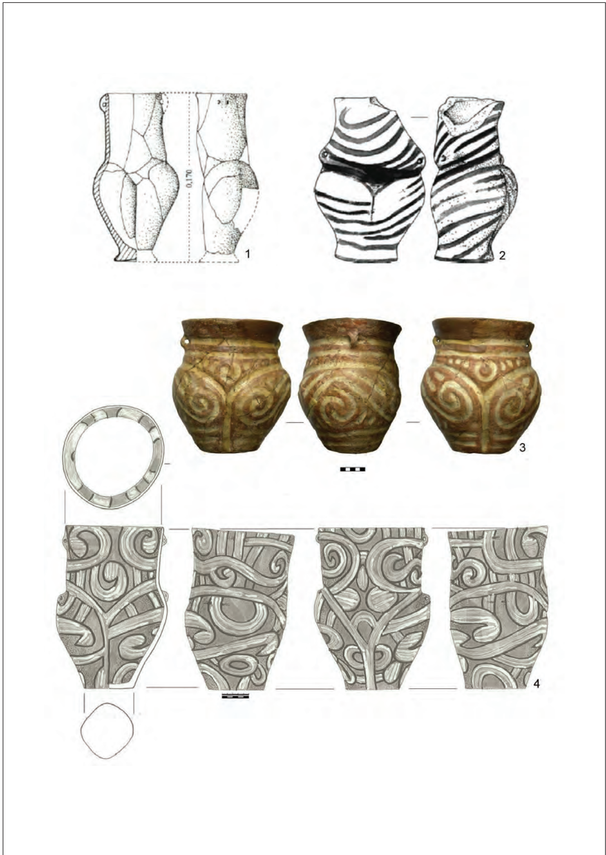
Pl. III. 1–4, vase antropomorfe. Cultura Cucuteni, faza A. 1, Hăbășești; 2, Cucuteni; 3, Drăgușeni; 4, Trușești. 1–4, după Țurcanu 2020 / Pl. III. 1–4, anthropomorphic vessels. Cucuteni Culture, phase A. 1, Hăbășești; 2, Cucuteni; 3, Drăgușeni; 4, Trușești. 1–4, after Țurcanu 2020.