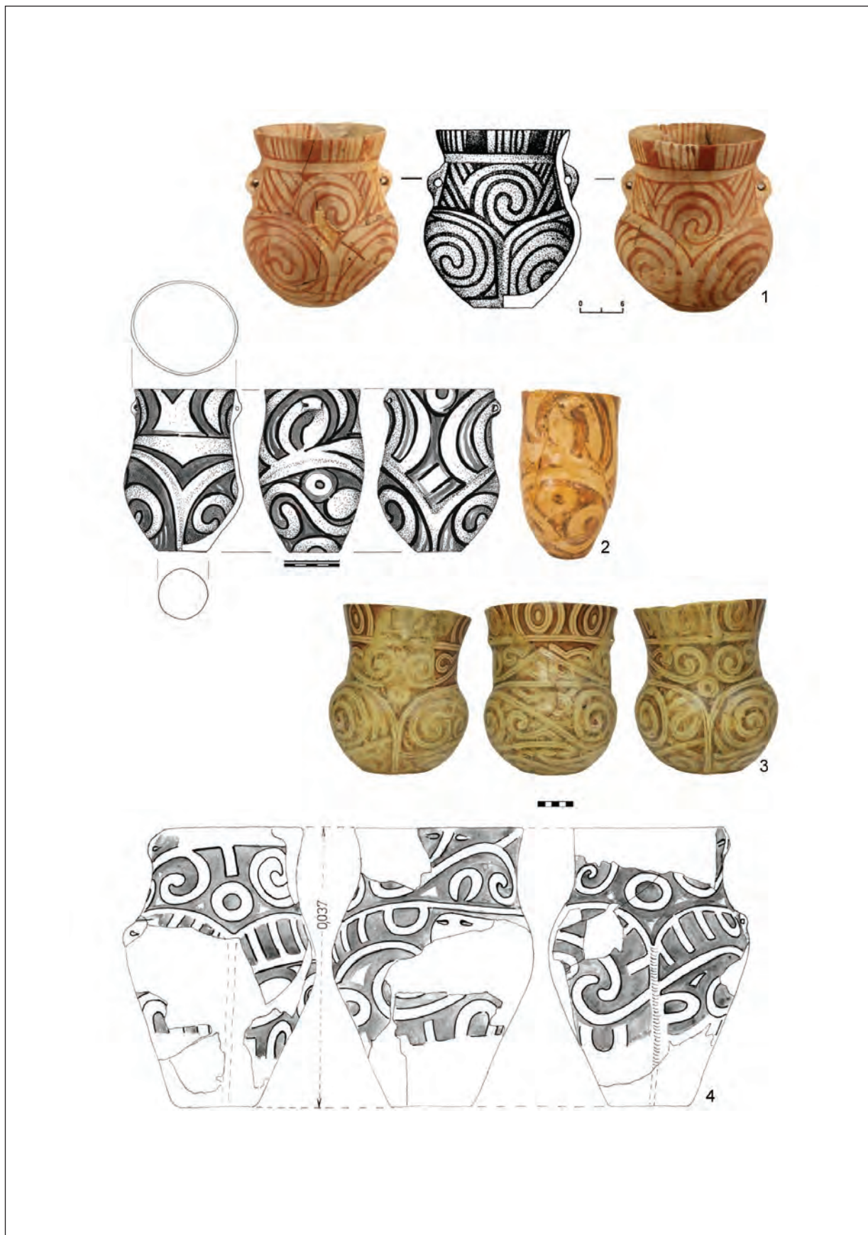
Pl. IV. 1–4, vase antropomorfe. Cultura Cucuteni, faza A. 1, Duruitoarea Nouă; 2–4, Truşeşti. 1–4, după Ţurcanu 2020 / Pl. IV. 1–4, anthropomorphic vessels. Cucuteni Culture, phase A. 1, Duruitoarea Nouă; 2–4, Truşeşti. 1–4, after Ţurcanu 2020.