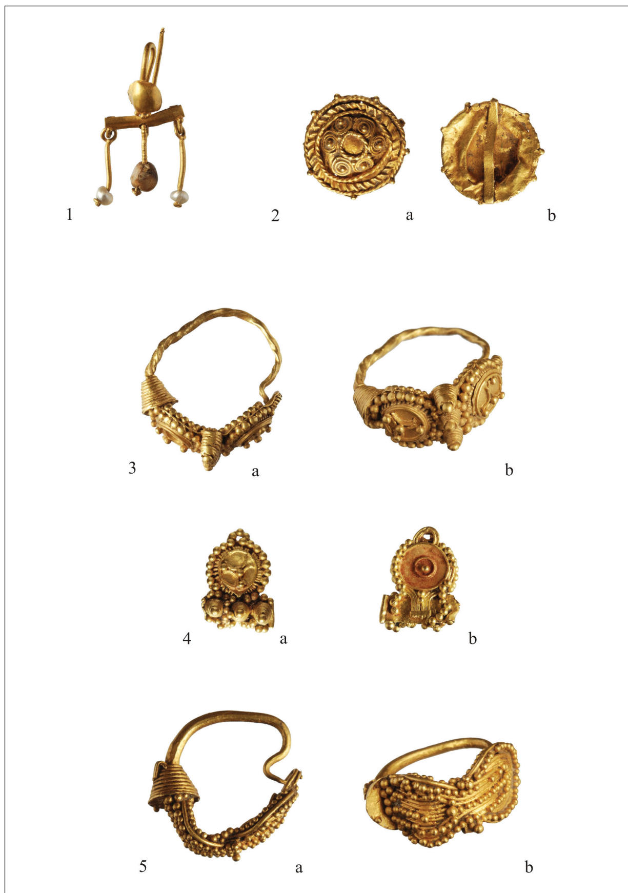
Pl.II. Cercei de aur din colecția Pongrácz.