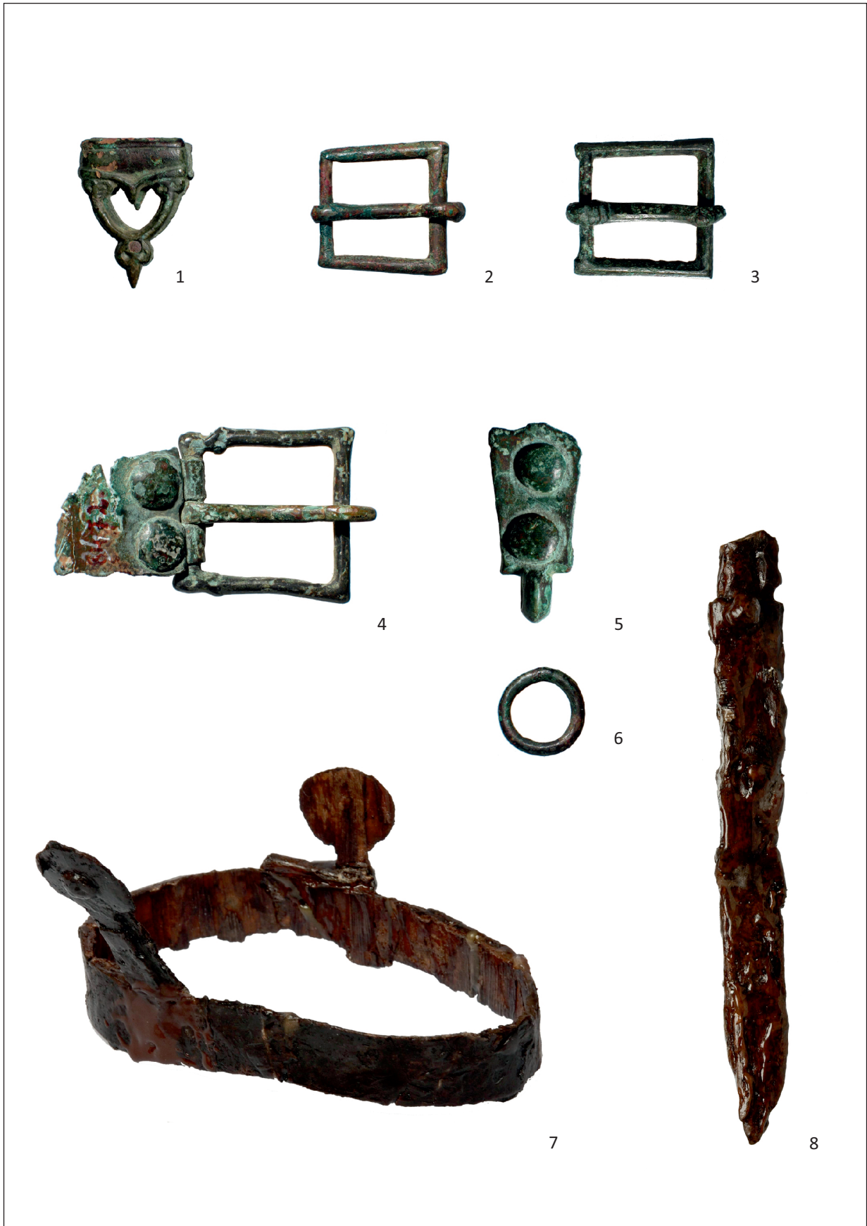
Pl. I. Timișoara – Podul Madoș – inventarul mormântului nr. 4: 1. Limbă de curea 2–3. Catarame 4. Cataramă cu placă 5. Agățătoare de centură 6. Verigă 7. Cerc de cofă 8. Pumnal. / Inventory of the grave 4: 1. Perforated strap end decorated with stylized lilies 2–3. Buckles 4. Buckle with plate 5. Climbing belt 6. Link 7. Circle cuff 8. Dagger.