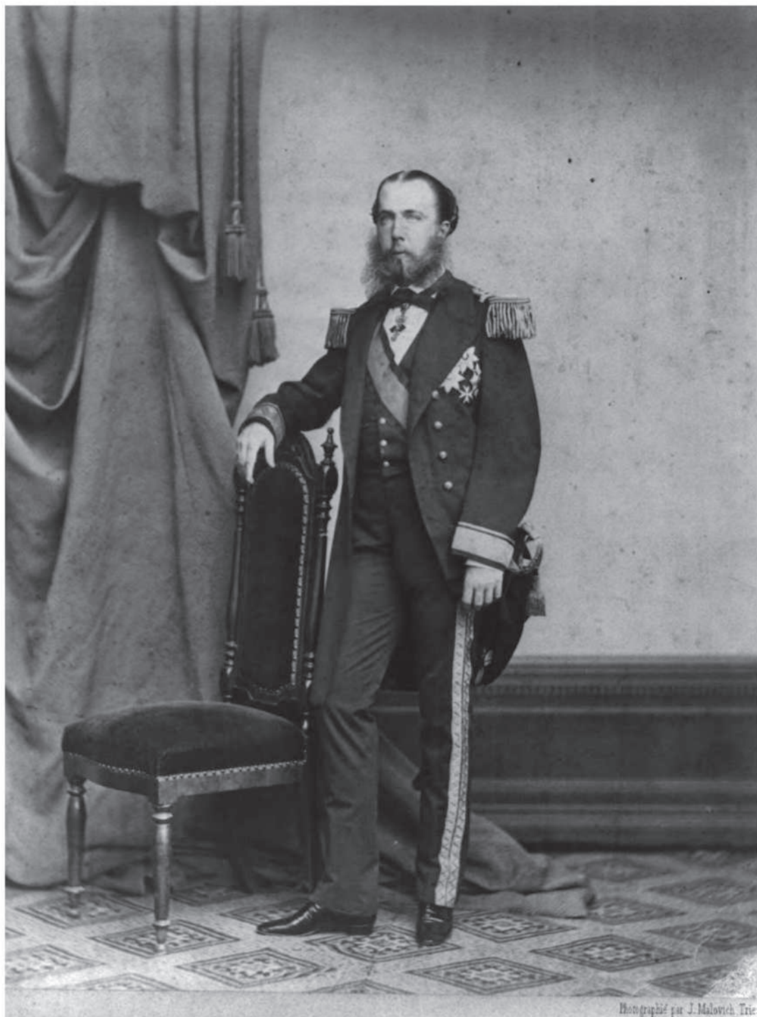
Pl. III. Ferdinand Maximilian Josef von Habsburg, arhiduce de Austria, împărat al Mexicului (1864–1867), / Ferdinand Maximilian Josef von Habsburg, Archduke of Austria, Emperor of Mexico (1864–1867)