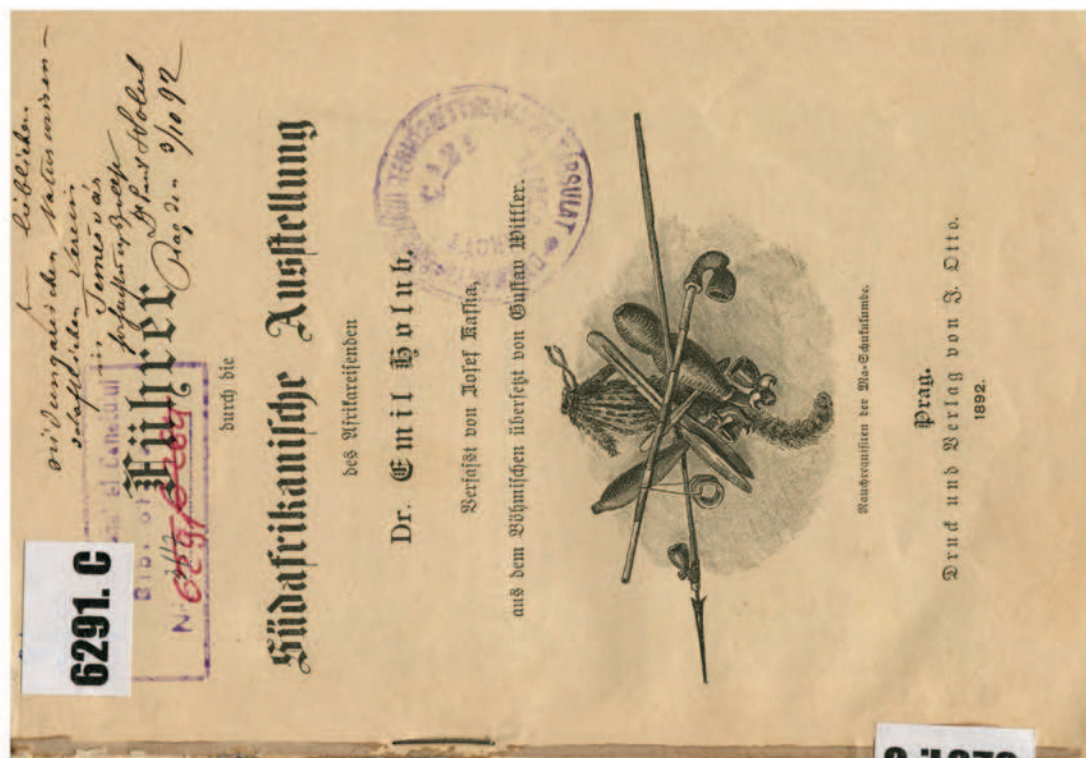
Pl. VI. Cărți donate de exploratorul ceh Emil Holub Societății de Științe Naturale din Timișoara (Biblioteca MNAB). / Books donated by the Czech explorer Emil Holub to the Society of Natural Sciences in Timișoara (NMoB library).