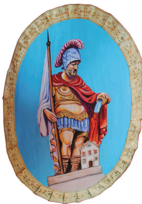
Fig. 4. Sfântul Florian pe medalionul Steagului aniversar pentru Serviciul Public de Pompieri Civili al Orașului Jimbolia 1875–2000.