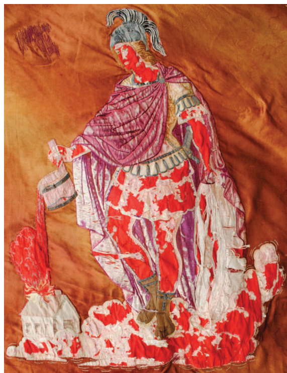
Fig. 6. Sfântul Florian pe medalionul Steagului aniversar Marienfelder Freiwillige Feuerwehr 1905–1930.