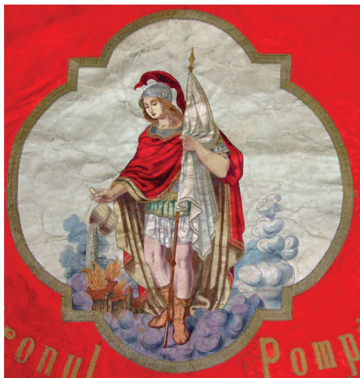
Fig. 5. Sfântul Florian pe medalionul Steagului Comandamentului Pompierilor Voluntari Timișoara-Cetate, 1898.