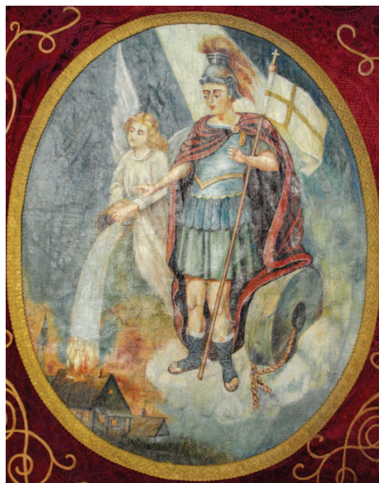
Fig. 2. Sfântul Florian pe medalionul Steagului aniversar al Reuniunii Pompierilor Voluntari din Ciacova, 1881–1931.