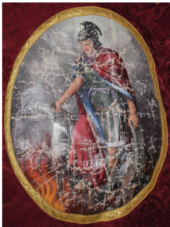
Fig. 7. Sfântul Florian pe medalionul Steagului Pompierilor Militari de la Buziaș.