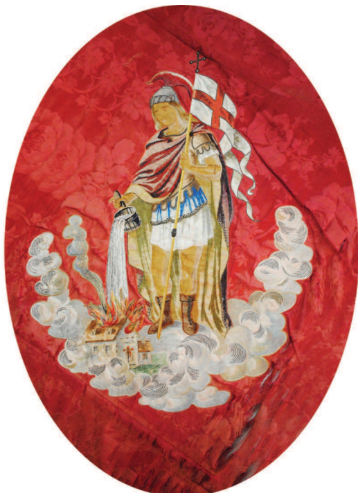
Fig. 3. Sfântul Florian pe medalionul Steagului Formației de Pompieri Civili Voluntari din Jimbolia, 1902.