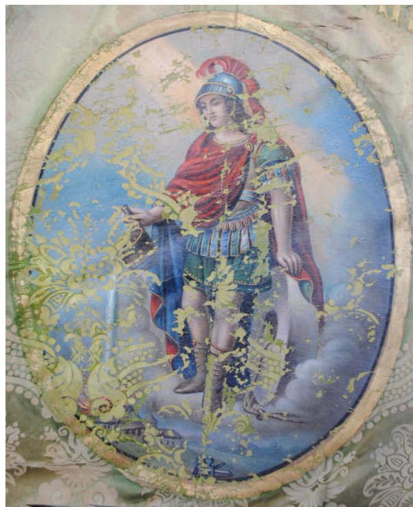
Fig. 9. Sfântul Florian pe medalionul Steagului Rotarilor și Potcovarilor din Sânnicolau Mare 1925.