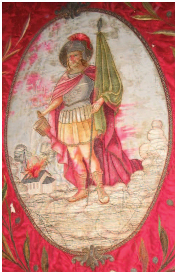
Fig. 8. Sfântul Florian pe medalionul Steagului Pompierilor Voluntari de la Sânnicolau Mare German.