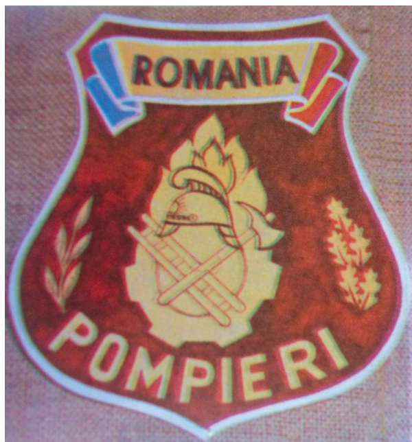
Figura 3. Ecuson pentru uniforma pompierilor militari (1993) / Abbildung 3. Abzeichen für die Uniform der Militärfeuerwehr (1993).