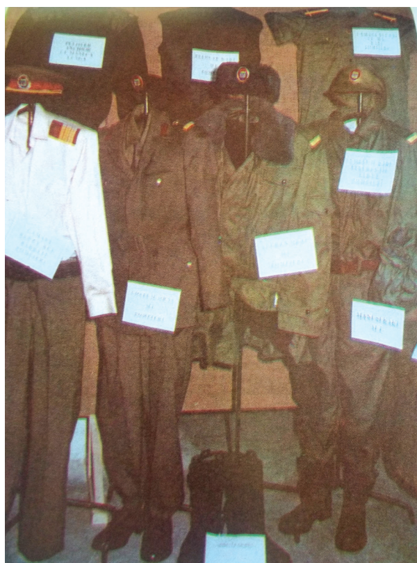
Figura 4. Ținuta pentru pompierii militari. / Abbildung 4. Das Outfit der Militärfeuerwehrleute. (Sursa: Arimia, Vasile. Fărău, Cornelia. Grigorie, Ioana. Popovici, Natașa. Rădulescu, Iuliana. (1996). Istoria pompierilor militari bucureșteni . Ediția I. București: Editura Luceafărul).

Chiar și denumirile purtate în decursul anilor de această instituția militară din Timișoara specializată în stingerea incendiilor și acțiuni de intervenție la calamități naturale și catastrofe, reprezintă tot un aspect al produselor fizice ale culturii organizaționale, prin care au comunicat întotdeauna anumite mesaje culturale și prin care s-a conturat imaginea acesteia.