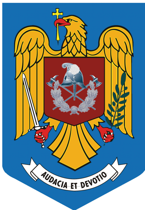
Figura 5. Însemnul heraldic al Inspectoratului General pentru Situații de Urgență. / Abbildung 5. Wappen des Generalinspektorats für Notsituationen.

a) acvila cruciată, aurie, cu capul îndreptat spre dreapta, cu aripile deschise, ciocul și ghearele roșii, având în cioc o cruce ortodoxă de aur, în gheara dreaptă o sabie de argint și în cea stânga o ramură de măslin verde – reprezintă un simbol al păcii și ordinii;