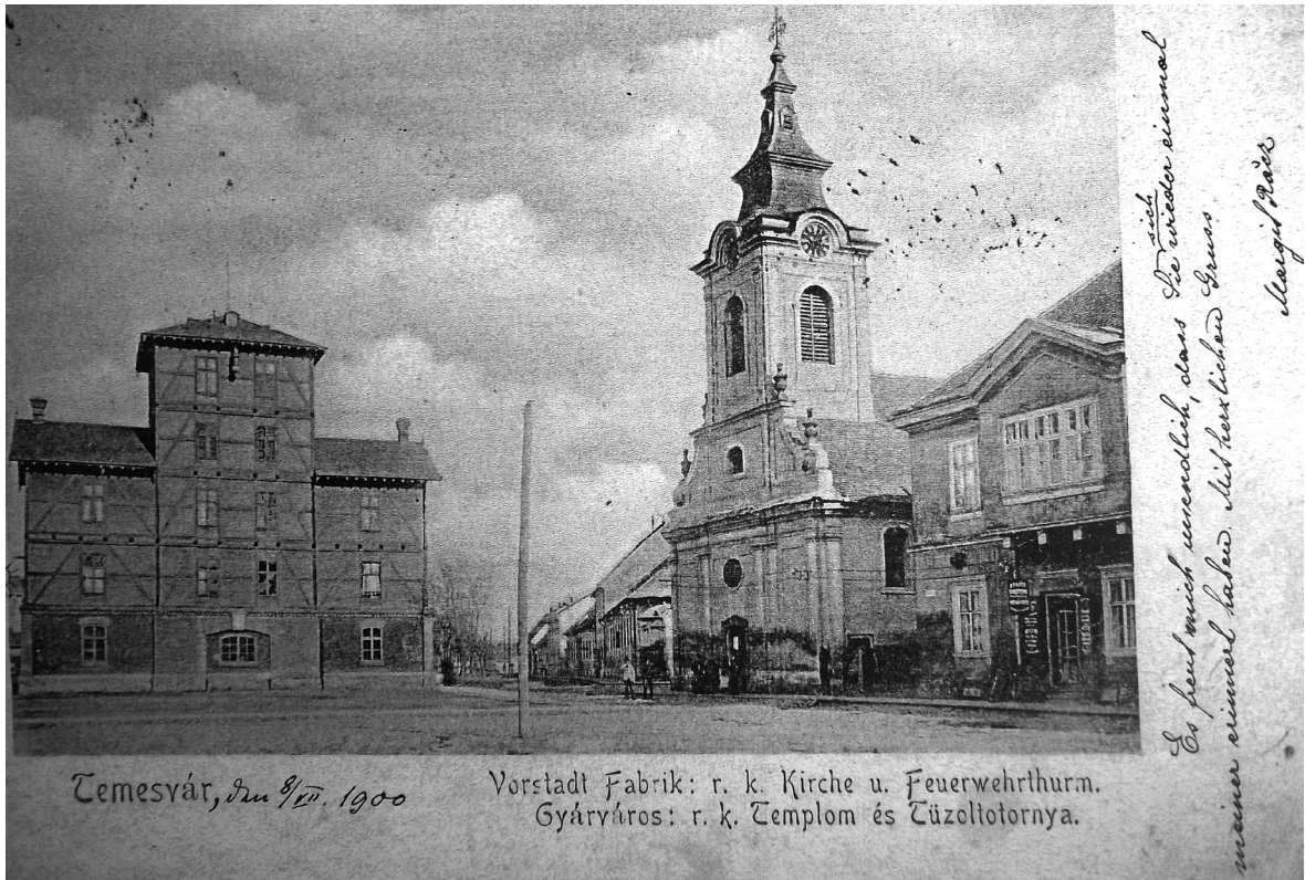
Figura 1. Sediul al Companiei de Pompieri Militari Timișoara. / Abbildung 1. Sitz der militärischen Feuerwehrkompanie Temeswar.