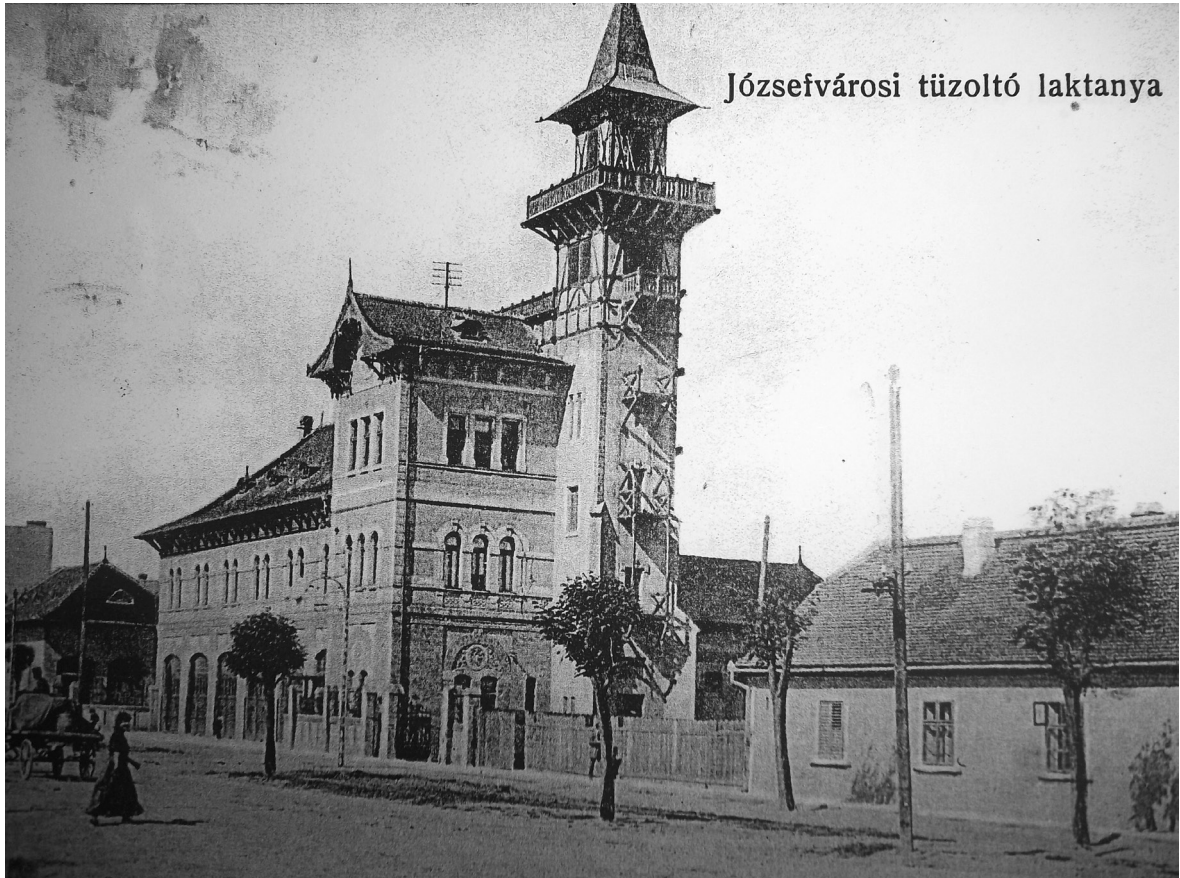
Figura 2. Sediul al Companiei de Pompieri Militari Timișoara din 1936. / Abbildung 2. Sitz der militärischen Feuerwehrkompanie Temeswar 1936.