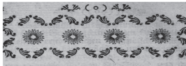
Fig. 5. Antetul primului capitol dedicat lui Deioces, p. 1 din Fragmente unbekannter Schriftsteller aus dem Alterthum , Timișoara, 1771.

Ornamentațiile alese de Heimerl ce constituie antetul fiecărui capitol sunt specifice societăților inițiatice, imaginile sunt semnificative și corelate cu conținutul capitolului în cauză. Lucrarea editorului J.F.V.T. , tipărită la Timișoara în 31 martie 1771, are în antetul primului capitol ce-i este dedicat lui Deioces, patru sori dispuși liniar (vezi Fig. 5 ).