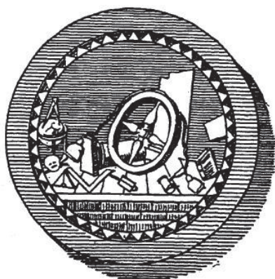
Fig. 11. Sigiliul Lojei Roata de Aur, din Abafi Lajos, Geschichte der Freimaurerei in Österreich-Ungarn , 5 vol., Budapesta, 1890–1899, vol. 3, Budapesta, 1893, p. 335, republicat în Gerald Schlag, Die Freimaurerloge „Zum goldenen Rad“ in Eberau 1775 – 1786 in „Burgenländische Heimatblätter“ Nr. 66, Eisenstadt 2004, p. 101.

Anterior trecerii Banatului la Ungaria, Baronul Kajetan von Rehbach ocupa funcția de președinte (administrator) al districtului Lugoj. În cadrul activității masonice din Timișoara, inițial, Baronul Kajetan von Rehbach nu a ocupat decât gradul de ucenic, dar, mai târziu, va parcurge toate etapele inițierii, devenind Maestru, fiind unul dintre Maeștrii semnatari ai actului de aniversare a Lojii Zum Goldenen Rad (Roata de Aur) din orașul Eberau, Austria, la data de 20 iulie 1785 101 .