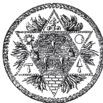
Fig. 2. Sigiliul Lojei Zu Den Drei Weisse Lilien , din Abafi Lajos: Geschichte der Freimaurerei in Österreich-Ungarn , 5 vol., Budapesta, 1890–1899, vol. 3, Budapesta, 1893, p. 4.

Sauvaigue, membru al Lojii Zur Hoffnung / Pentru Speranță din Viena. Sauvaigue va sista activitatea acestuia, dar nu va renunța la ideea înființării unei societăți secrete în oraș. Cu ajutorul câtorva inițiați sosiți de pe întreg teritoriul imperiului, va fonda în Timișoara, cel mai probabil în anul 1776 Loja masonică Zu Den 3 Weisse Lilien/La Trei Crini Albi după sistemul observației Draskovich în care va atrage și alte personalități. Plasată sub influența masoneriei vieneze, formată din membrii de naționalități diferite, loja timișoreană și-a ales motto-ul: „ Vivat Concordia et Lux ”! și un sigiliu (vezi Fig. 2. ) ce are în compoziție o simbolistică specifică ce reunește elemente folosite atât de templieri și rozicrucieni, cât și de masoni 61 .