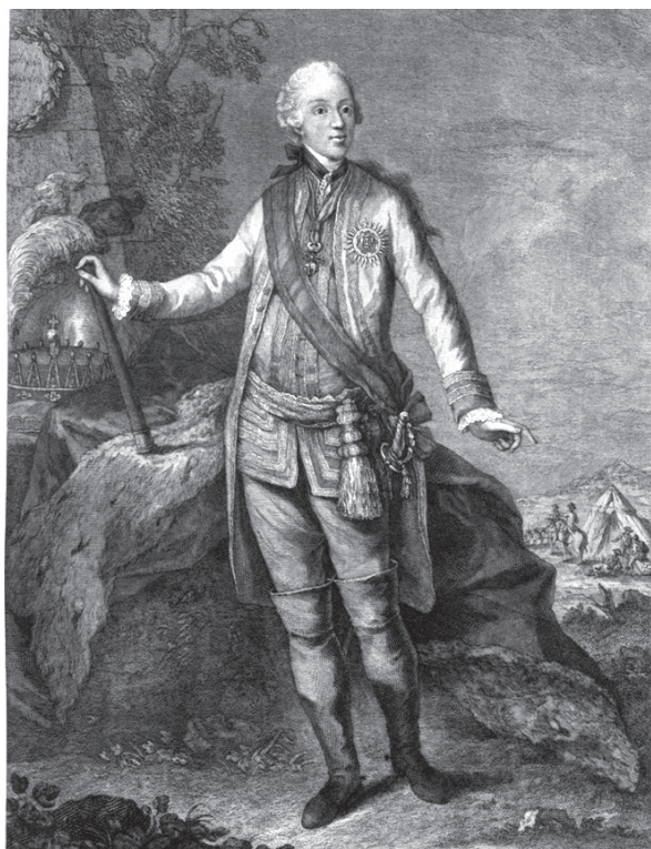
Fig. 13. Albert Herzog von Sachsen-Teschen (Wien, Österreichische Nationalbibliothek, Bildarchiv und Grafiksammlung, Porträtsammlung, Nr. Inv. PORT_00055996_01)

și președintele Camerei Aulice de Conturi – contele Johann Joseph von Khevenhüller – Metsch. Într-o perioadă foarte scurtă de timp, prințul Albert a reușit să o convingă pe Maria Tereza să accepte cedarea Banatului. Chiar dacă, printr-un alt memoriu din data de 29 noiembrie 1777 adresat împărătesei, premegător negocierilor oficiale, consilierii din Cadrul Cancelariei Aulice Boemo-Austriece s-au opus din nou retrocedării Banatului, reamintindu-i că acest teritoriu aparține coroanei, având o poziție militară geo strategică importantă, Maria Tereza nu a ținut cont de aceste mențiuni.