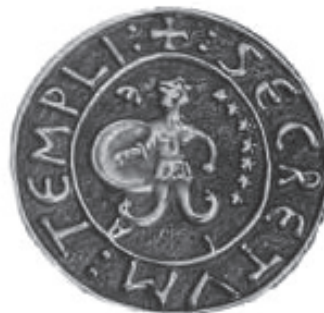
Fig. 3. Reproducere a sigiliului Marelui Maestru al Ordinului Templierilor (+: SECRETUM: TEMPLI) din Bernard Marillier: Armorial des Maîtres de l'Ordre du Temple suivi de Essai sur la symbolique templière , Pardès, 2000.

Amprenta sigilară a Lojei din Timișoara, de formă rotundă, prezintă o hexagramă înscrisă într-un cerc. Hexagrama (hexagonul stelat sau steaua cu