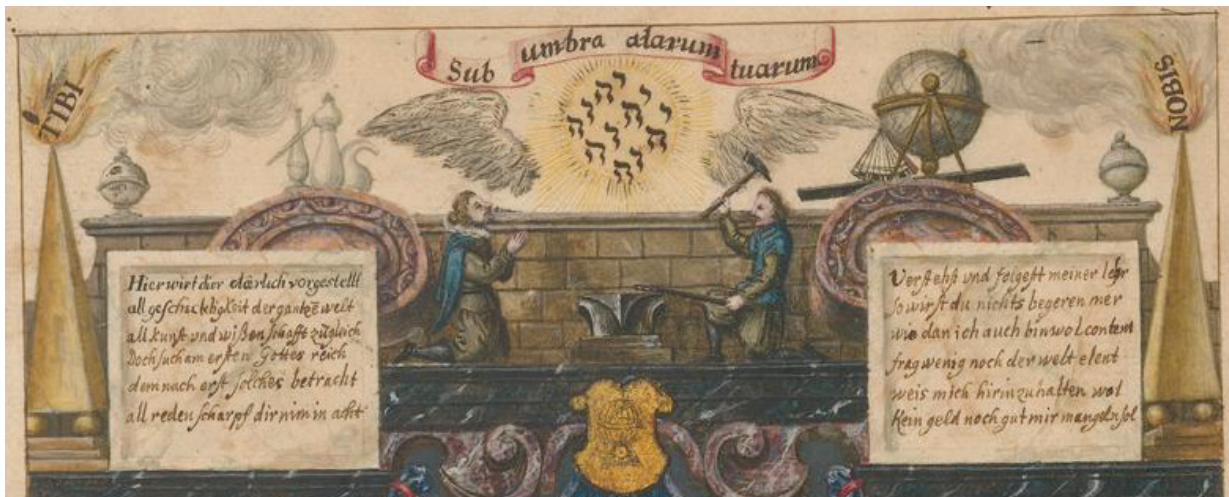
Fig. 8. Imaginile numelui inefabil amplasat între aripile îngerilor, din Daniel Mögling, Speculum sophericum rhodo-stauroticum , 1618, Zentralbibliothek Zürich, SCH R 201.

călugări conduși de Sf. Brandano, aflați în căutarea insulelor binecuvântate ( Terra repromissionis ). În fiecare Paște călugării erau aduși de vânt, înapoi pe aceeași insulă, unde sărbătoreau Liturgia Paștelui. După șapte ani din acest ciclu, au descoperit că insula era de fapt partea din spate a lui Jasconius 92 .