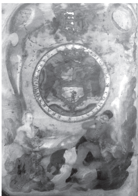
Fig. 15. Blazonul acordat ca însemn comitatului Caraș din Diploma publicată în Cartea Regală , nr. 51, 1779, pp. 78 – 80, (cu o miniatură reprezentând blazonul la începutul textului). Originalul diplomei se află la SJAN Timiș, Colecția de documente a Muzeului de istorie Lugoj , dosar 108/1779.

Caraș 139 și Torontal 140 a stabilit granițele teritoriale și însemnele acestora. Formarea comitatelor Caraș, Timiș, Torontal, în primăvara anului 1779, este rezultatul deciziei împărătesei Maria Terezia de a răspunde favorabil pretențiilor nobilimii maghiare de încorporare a Banatului la Ungaria. Banatul a fost împărțit în trei comitate, sediul administrativ a fost stabilit pentru comitatul Timiș la Timișoara, pentru comitatul Caraș la Lugoj, iar pentru comitatul Torontal la Becicherecul Mare. Prefecții și subprefecții numiți de la Cancelaria Curții Ungare vor reprezenta oficialitățile comitatelor. Primii funcționari au fost numiți și nu aleși. Majoritatea funcționarilor numiți proveneau din rândurile vechii nobilimii sau clasei mijlocii maghiare.