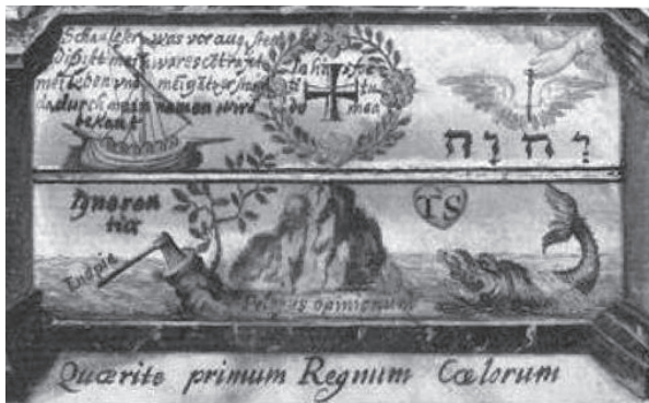
Fig. 9. Imaginea insulei din mijlocul mării ignoranților, spre care se îndreaptă corabia călăuzită divin din Daniel Mögling, Speculum sophericum rhodo-stauroticum , 1618, Zentralbibliothek Zürich, SCH R 201.

călugări conduși de Sf. Brandano, aflați în căutarea insulelor binecuvântate ( Terra repromissionis ). În fiecare Paște călugării erau aduși de vânt, înapoi pe aceeași insulă, unde sărbătoreau Liturgia Paștelui. După șapte ani din acest ciclu, au descoperit că insula era de fapt partea din spate a lui Jasconius 92 .