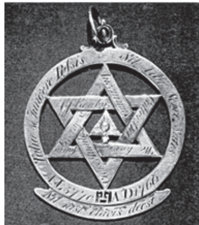
Fig. 4. Imagine a celei mai vechi bijuterii, datată 1766, corespondentă gradului de Arcă Regală. A aparținut Dr.J.J.Rouby. Se remarcă gravate expresiile referitoare la cele 10 sefire pe cele două triunghiuri din care se formează hexagrama. (Bernard E. Jones, Freemasons' Book of the Royal Arch , London: George G. Harrap & Company Ltd, 1957)

doar cheia... ) amplasată subiacent cercului ce conține hexagrama, este oarecum corelată cu expresia gravată pe cercul ce înconjoară hexagrama: Si talia jungere possis sit tibi scire satin ( Tu poți înțelege ceea ce urmează, dacă tu știi suficient! ) 66 .