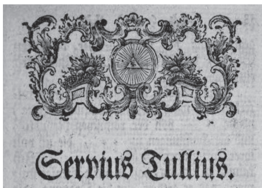
Fig. 6. Antetul capitolului dedicat lui Servius Tullius, p. 57 din Fragmente unbekannter Schriftsteller aus dem Alterthum , Timișoara, 1771.

Manuscrisele în posesia cărora a intrat J.F.v. T. au stat la baza textelor pe care le-a redactat iar el speră ca această muncă să-i aducă un spor de salar 87 . În ordinele inițiatice, în special în masonerie, se cunoaște faptul că un Maestru poate propune sporul de salariu pentru un Ucenic sau o Calfă doar în cazul în care aceștia au lucrat suficient timp cu ei însuși , deciptând cu asiduitate învățămintele grafului în care au fost admiși prin ritual.