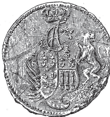
Fig. 12. Sigiliul Capitulum Provincial al SOT din Praga, Ludwig Abafi, Geschichte der Freimaurerei in Österreich-Ungarn , 5 vol., Budapesta, 1890–1899, vol. 3, Budapesta, 1893, p. 12.

Zu den drei Schwertern / La cele trei săbii în anul 1764 110 , Palatinul Ungariei (funcție deținută încă din 1765) va avea o influență majoră în dezvoltarea masoneriei la Dresda dar și la Praga, Bratislava și Viena. Va rămâne cunoscut în istoria masoneriei drept un protector puternic al activității acesteia. Loja din Praga Zu den drei gekrönten Sternen und den drei gekrönten Säulen , înființată în anul 1773 după sistemul Strictei Observanțe Templiere, își va schimba numele în onoarea sa, adoptând denumirea de Casimir zu den drei gekrönten Sternen und drei gekrönten Säulen . În anul 1775 Capitulum Provincial al Saxoniei, înființat la Praga a fost numit Kasimir zu den neun Sternen , sigiliul său va avea în compoziție monograma sa (Casimir Albert) și elemente dispuse similar unui scut blazon (vezi Fig. 12.).