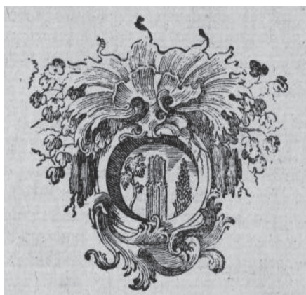
Fig. 7. Imaginea Oglinzii amplasată la finalul capitolului dedicat lui Sophronim, din Fragmente unbekannter Schriftsteller aus dem Alterthum , Timișoara, 1771, p. 175.

Pe ultima filă a cărții tipărite de Matthäus Josephus Heimerl, în capitolul dedicat înțeleptului Sophronim din Argos, apare oglanda (Vezi Fig. 7.) în care se reflectă o lume ideatică a „ misterioasei insule ” unde acesta trăia când a fost descoperit de marinarii ce au naufragiat în călătoria lor spre Creta, navigând din Delos.