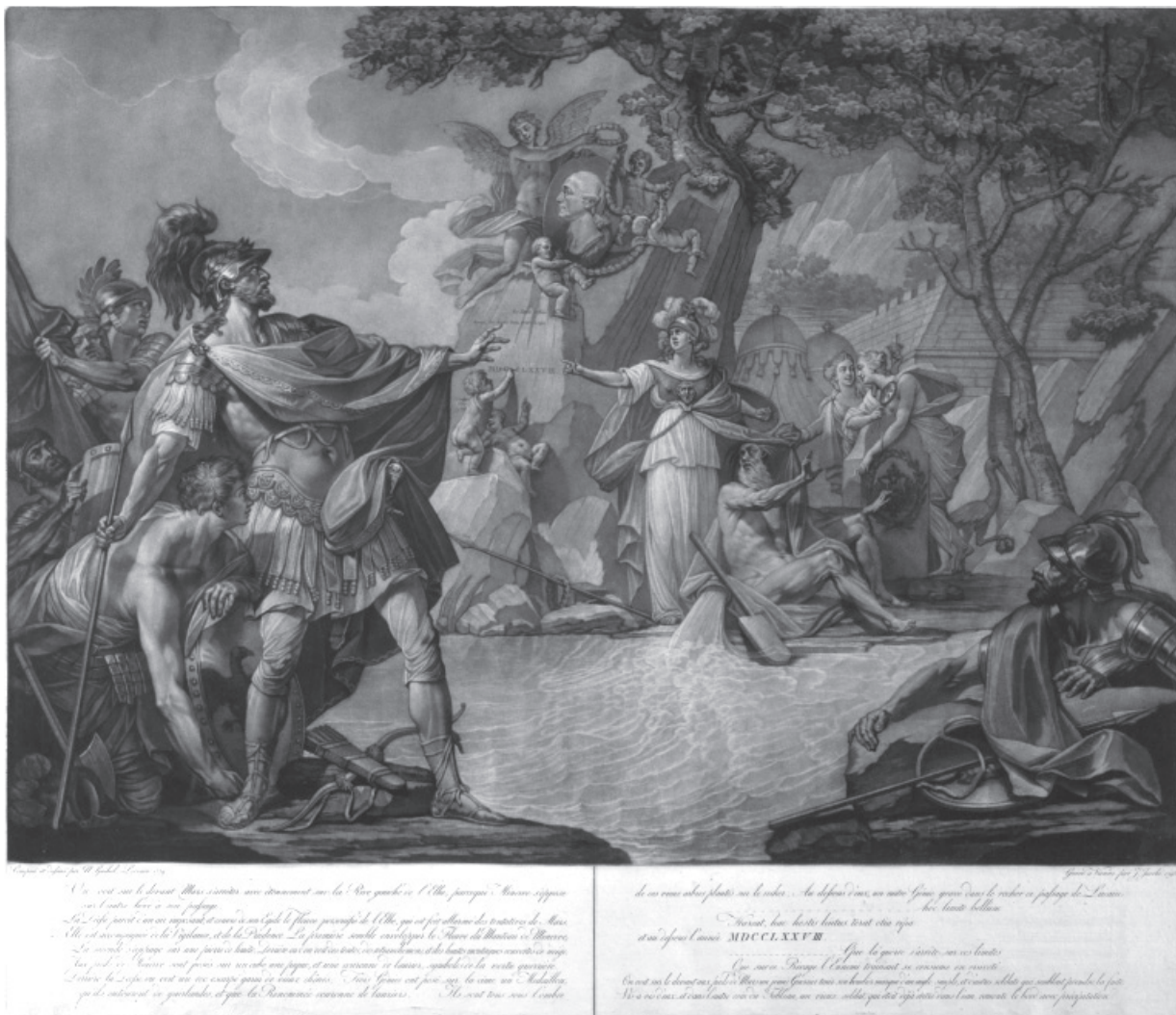
Fig. 14. Allegorie auf den Einfall von Preußen in Böhmen 1778 (Bayerischer Erbfolgekrieg 1778–1779 „Kartoffelkrieg“), desen Nicolas Guibal, 1778, ÖNB Nr. Inv. 284.371-B.

din cauza numărului mic al soldaților existenți în tabără este necesar aducerea de noi contingente de ostași din părțile bănățene 125 . În luna iulie 1778 vor mai veni încă 800 de militari din Banat în sprijinul lui Iosif al II-lea 126 . Războiul de succesiune bavarez s-a caracterizat doar prin manevre militare în Boemia, neexistând lupte directe între Austria și Prusia. Din ambele armate au fost dezertori, în majoritatea timpului armatele rivale au umblat după provizii....soldații austrieci au fost obligați să se hrănească în principal cu cartofi din cauza condițiilor meteo nefavorabile și a proastei aprovizionări, motiv pentru care, în batjocură, prusacii i-au spus „războiul cartofului” 127 . Până în octombrie 1778 armata prusacă se retrăsese în țară, ambele părți erau gata să înceapă negocierile pentru pace. Pentru prima dată în istoria puterilor europene,