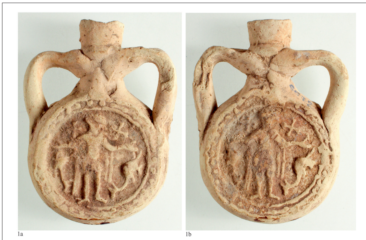
Fig. 2. Ploscuță cu reprezentarea Sfântului Mina, descoperită la Dierna/Orșova (?), nr. inv.6572-foto. / Saint Menas flask, discovered in Dierna/Orșova (?), inventory no. 6572 – photo.