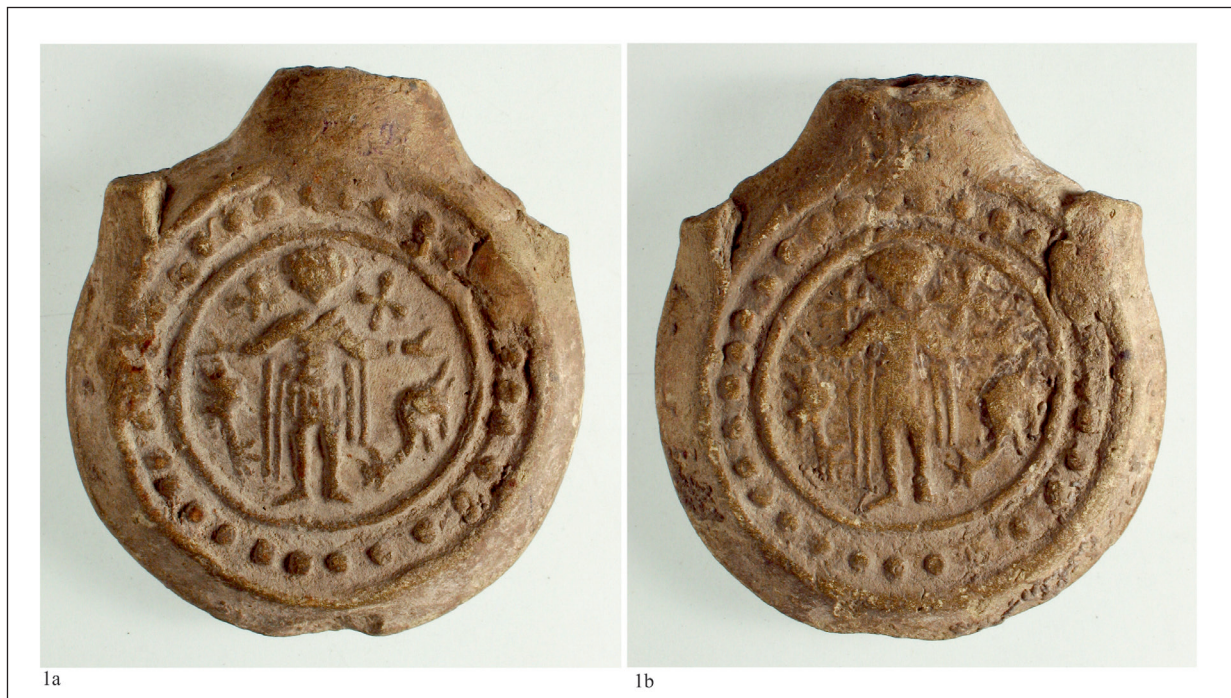
Fig. 4. Ploscuță cu reprezentarea Sfântului Mina, loc de descoperire necunoscut, nr. inv.36.972-foto. / Saint Menas flask, unknow discovery place, inventory no. 36.972 – photo.