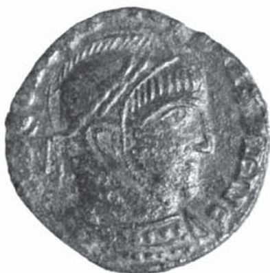
Tibiscum – jud. Caraş-Severin