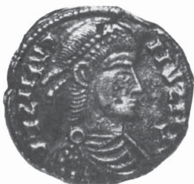
Pojejena de Sus – jud. Caraş-Severin